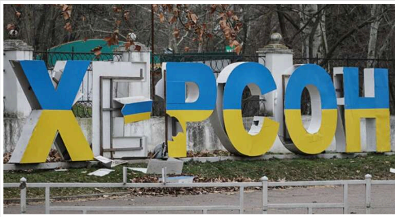
Внаслідок обстрілу Херсона постраждали п'ятеро співробітників комунального підприємства

Внаслідок обстрілу росіянами Херсона були поранені п'ятеро працівників комунального підприємства.