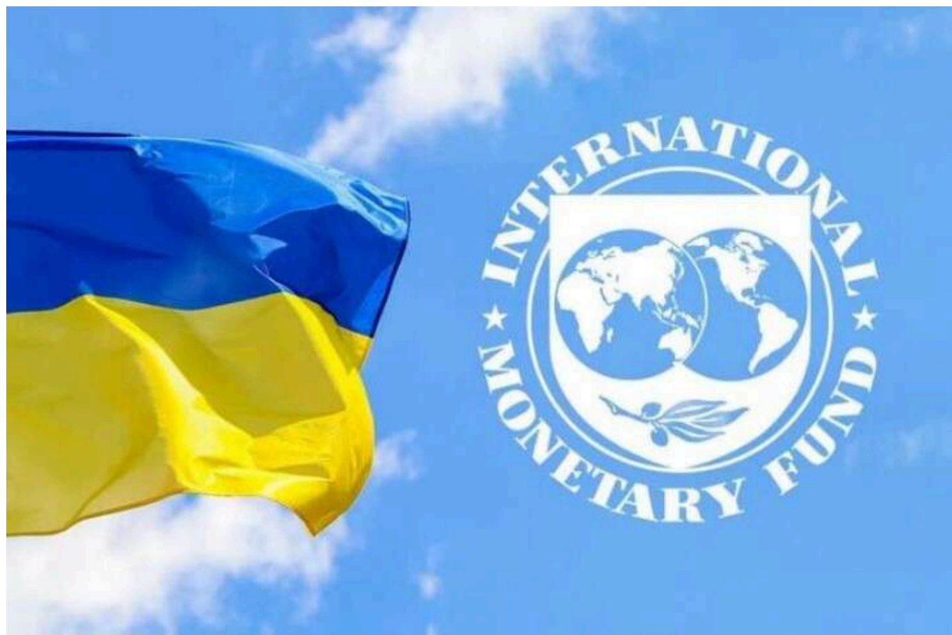
МВФ змінив свій прогноз: ситуація в економіці України погіршилась

Економічна ситуація в Україні погіршиться. МВФ змінив короткостроковий макропрогноз. У рамках перегляду програми EFF МВФ також переглянув макропрогноз для України.