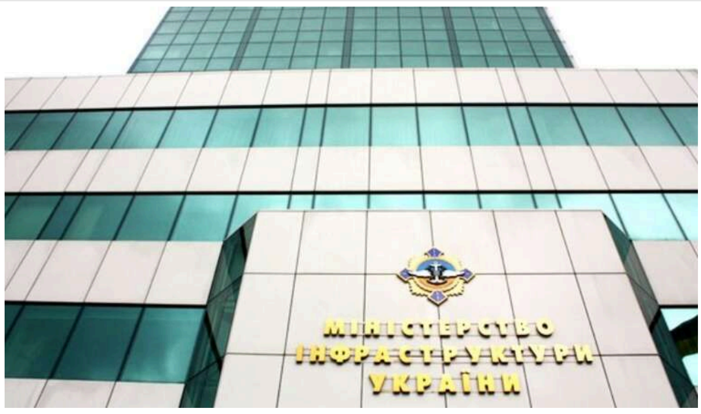
Трьома компаніями Міністерства відновлення України керують обвинувачені в корупції

У Міністерстві відновлення України, яке вже понад рік очолює Олексій Кулеба, на керівних посадах продовжують працювати принаймні троє керівників структурних підприємств.