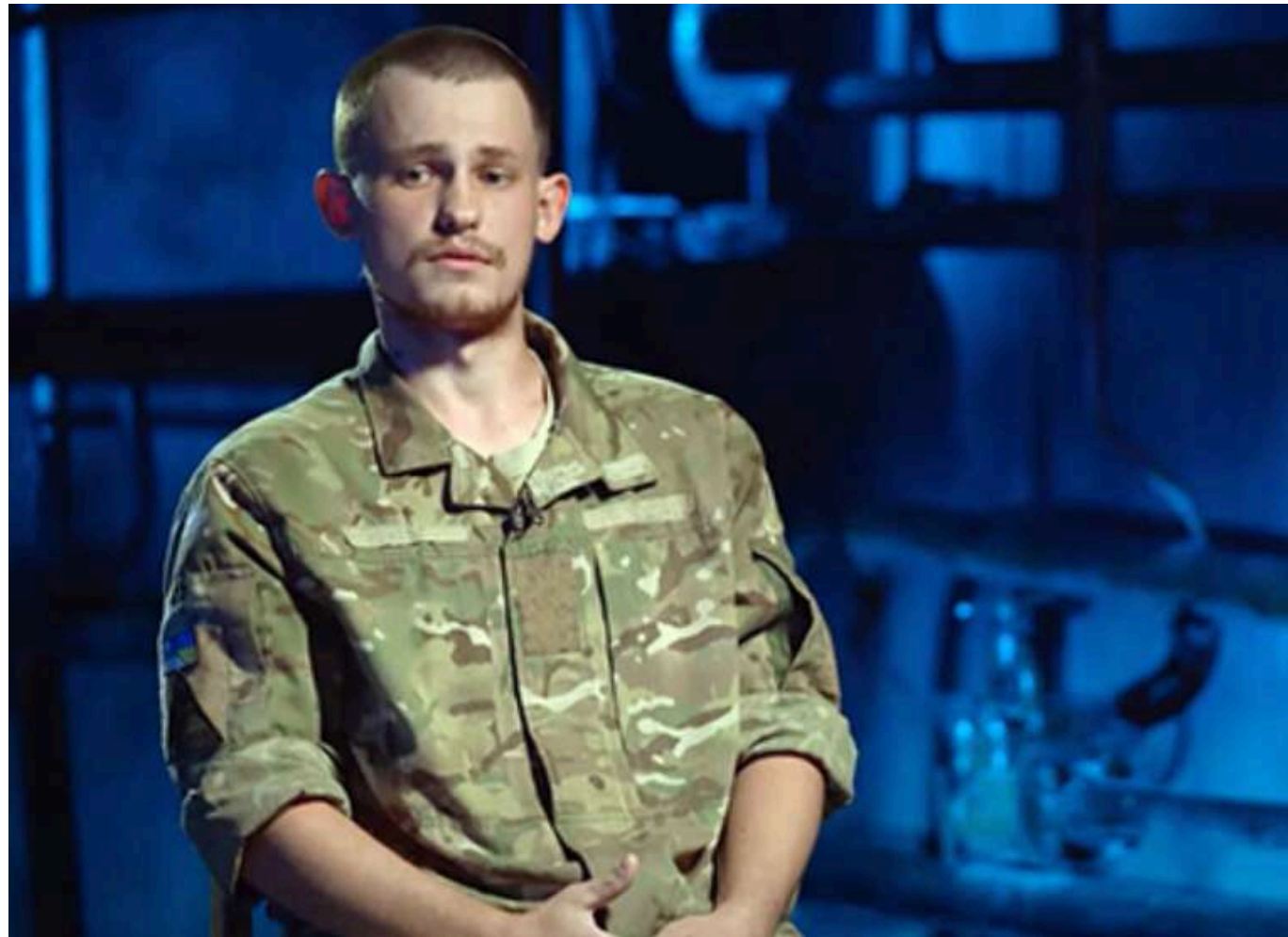
Російський доброволець розповів, як усунув своє командування і приєднався до України

Командири підрозділів "Шторм Z" віддають накази розстрілювати росіян, які відмовляються йти на штурм українських позицій. Одного з таких командирів було ліквідовано добровольцем з позивним "Сільвер" перед тим, як він приєднався до легіону "Свобода Росії".