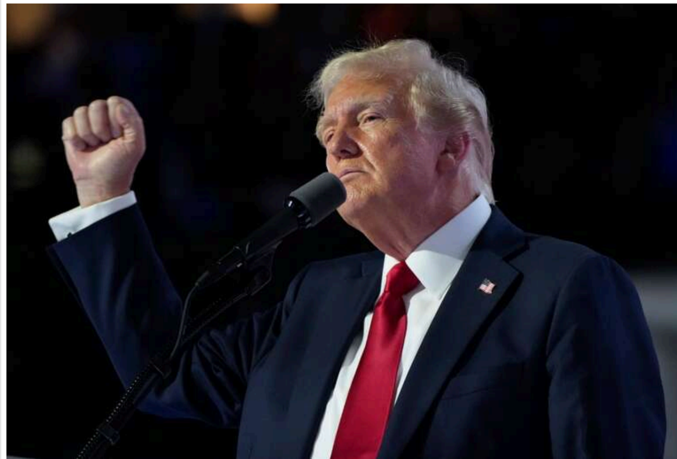
Трамп на 20 хвилин залишився без мікрофонів під час промови на мітингу

Кандидат у президенти США від Республіканської партії Дональд Трамп на 20 хвилин свого передвиборчого мітингу залишився без робочого мікрофона, після чого заявив, що не заплатить компанії-орендодавцю обладнання.