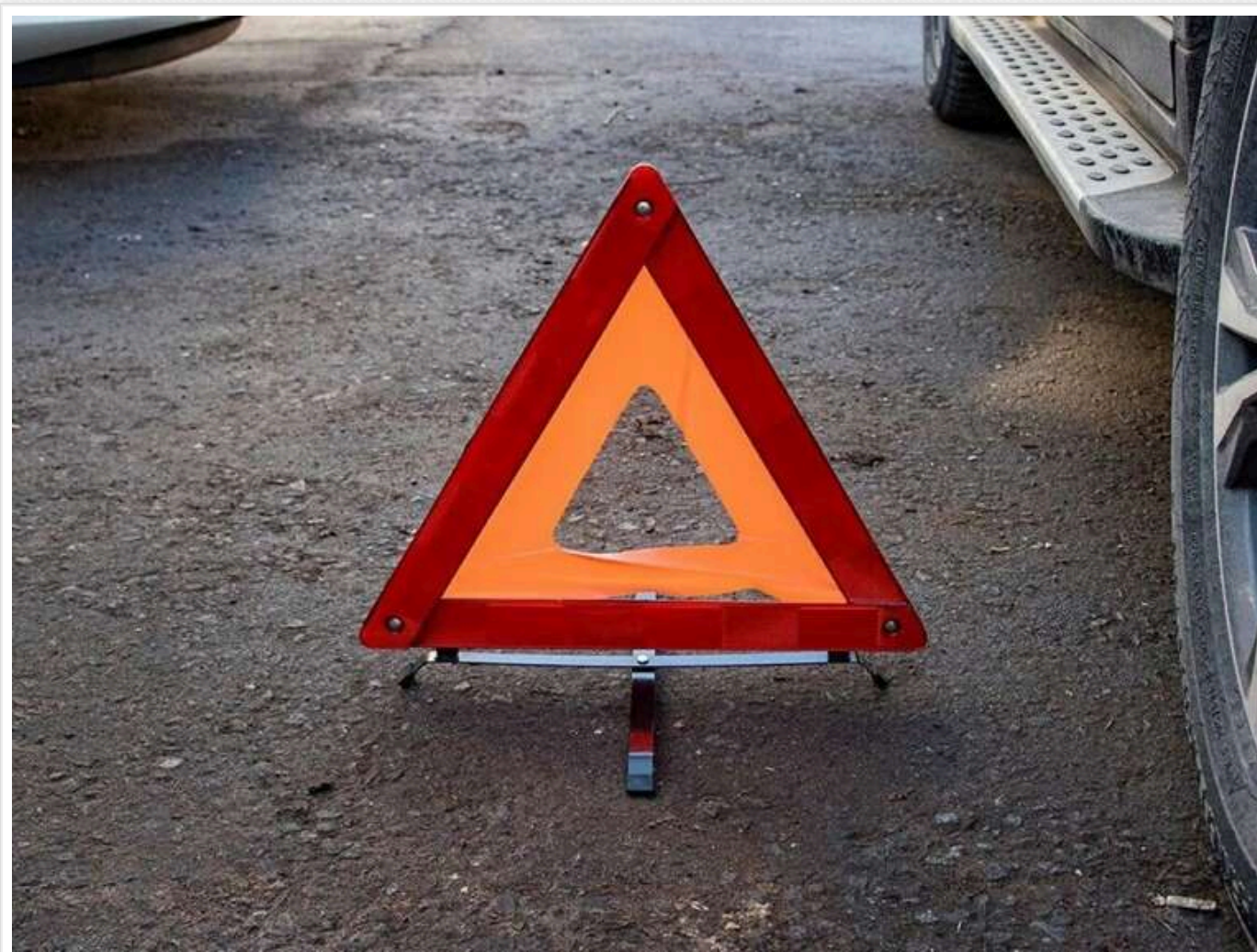
П'яний водій насмерть збив жінку на Миколаївщині

У соціальних мережах з'явилося відео, на якому в Южноукраїнську автомобіль Daewoo Lanos збив жінку, яка переходила дорогу на нерегульованому пішохідному переході.