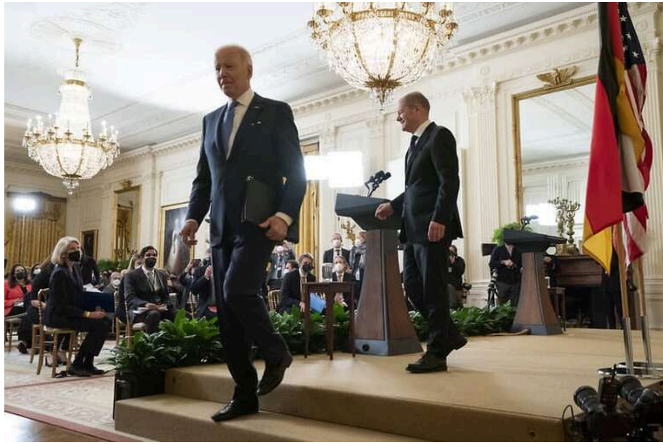
Шольц заявив, що залучення НАТО у війну в Україні призведе до катастрофи

Шольц заявив на пресконференції з Байденом, що важливо запобігти залученню НАТО до війни в Україні, оскільки це може призвести до катастрофи.