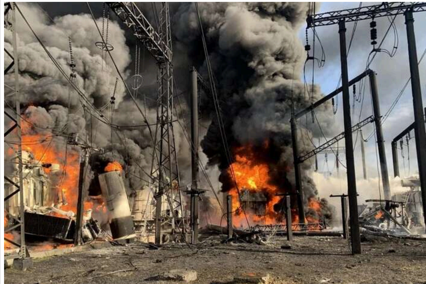
Ракетний терор РФ сповільнив економічне зростання України

Ракетні атаки Росії на українську енергетичну інфраструктуру завдали значного удару по економічному потенціалу країни. У зв'язку з цим економічне зростання країни значно сповільниться цього та наступного року.