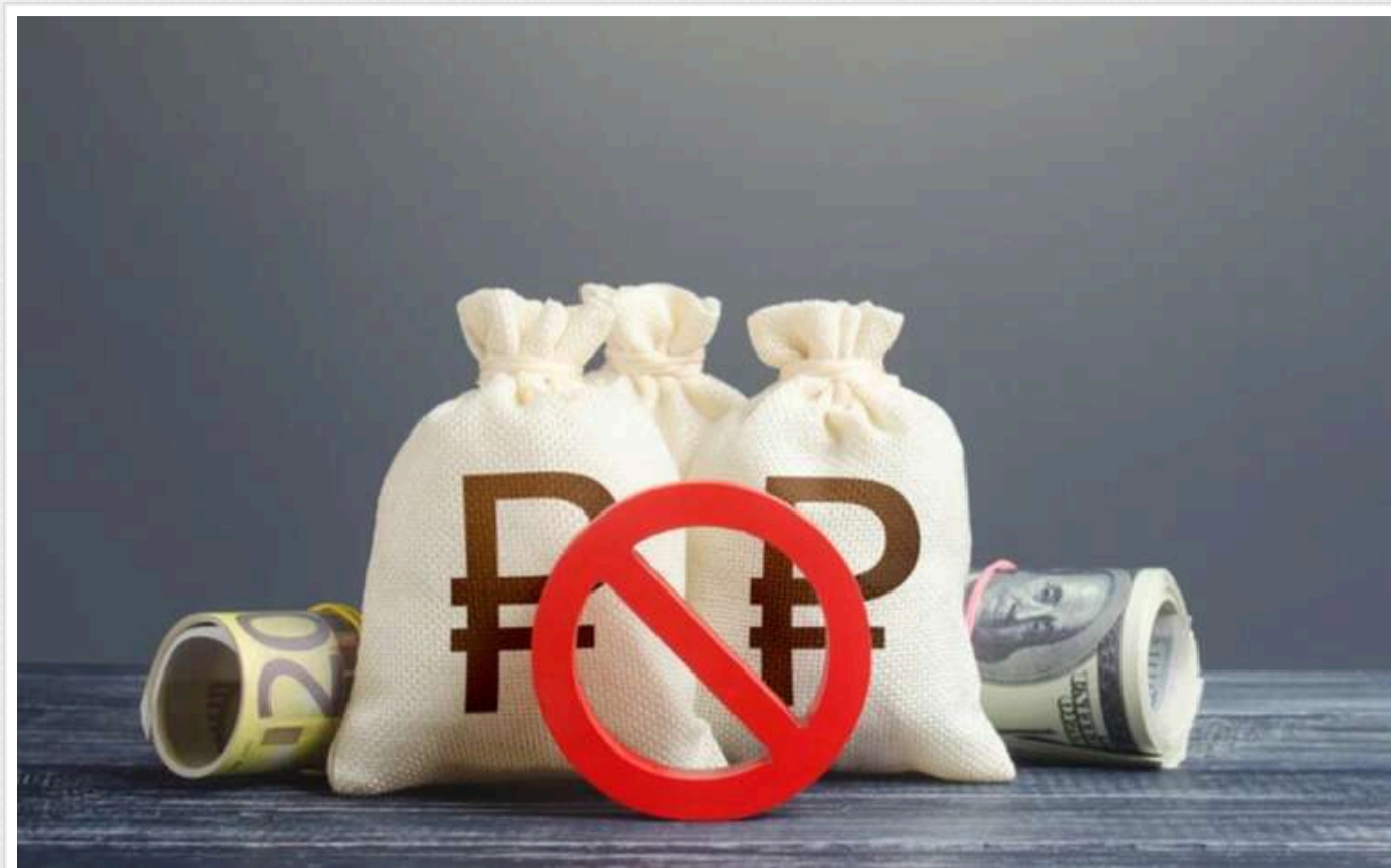
Росія може отримати назад заморожені мільярди доларів

Заморожені російські активи залишатимуться під санкціями Європейського Союзу (ЄС), поки триває війна, а Росія не компенсує Україні всі заподіяні збитки. Для цього знадобиться солідарність усіх країн-членів Євросоюзу.