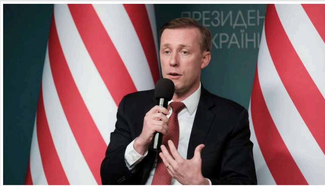
Україні необхідно провести реформи і "дотриматися умов безпеки" для отримання запрошення в НАТО, - Салліван

Це заявив радник президента з нацбезпеки Джейк Салліван.