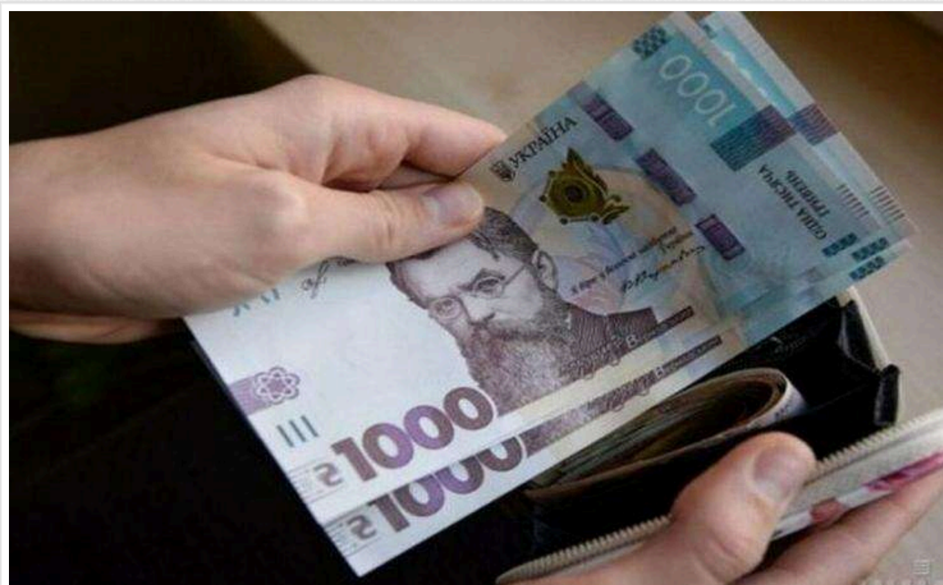
В Україні з 1 жовтня зростає допомога з безробіття для деяких категорій населення

З 1 жовтня мінімальну допомогу з безробіття збільшено з 2500 до 3600 грн для певних категорій громадян, повідомляє Кабмін.