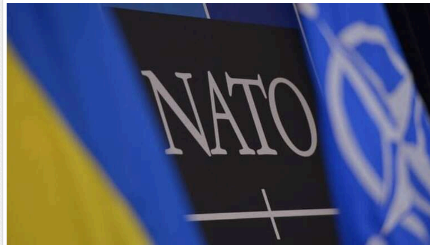
Консенсусу щодо запрошення України в НАТО немає, - Білий дім

Високопоставлений представник адміністрації президента США повідомив про те, що серед членів Північноатлантичного альянсу відсутня єдність у питанні запрошення України в НАТО.