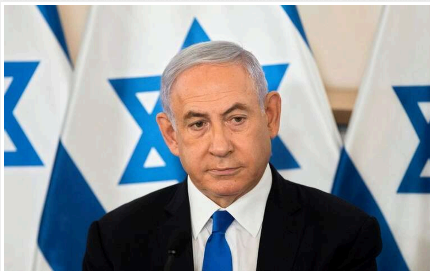
Нетаньягу: Операція в Газі не закінчиться після ліквідації голови ХАМАС

Глава уряду Ізраїлю Беньямін Нетаньягу зазначив, що військова операція в Секторі Гази не завершиться після сьогоднішньої ліквідації лідера ХАМАС Сінвара і буде продовжена до звільнення всіх заручників.