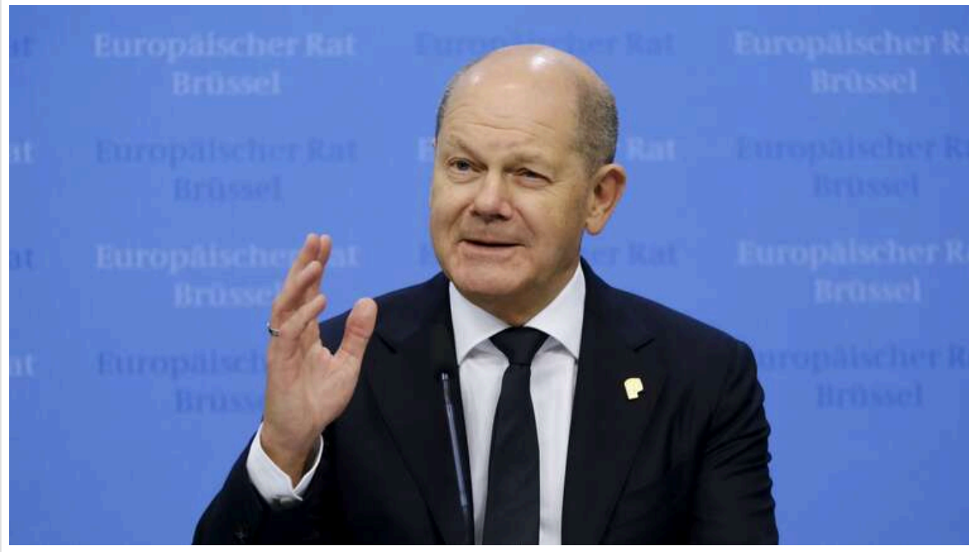
Шольц відхилив важливі пункти Плану перемоги Зеленського через побоювання подальшої ескалації