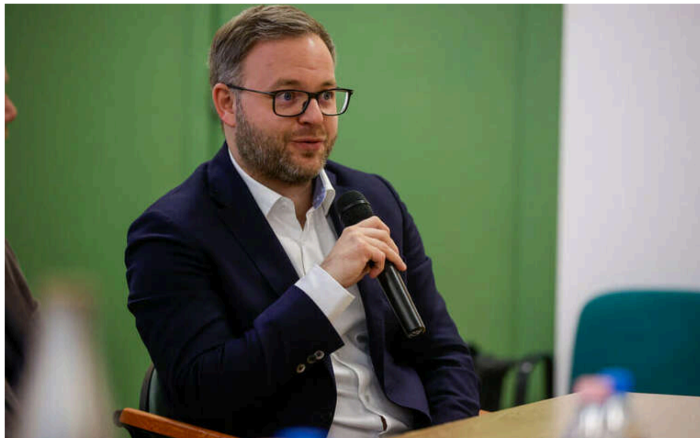
План Зеленського - "найкоротший шлях до розв'язання Третьої світової війни", - Балаж Орбан

Будешит закликає НАТО обмежитися "дипломатичними засобами".