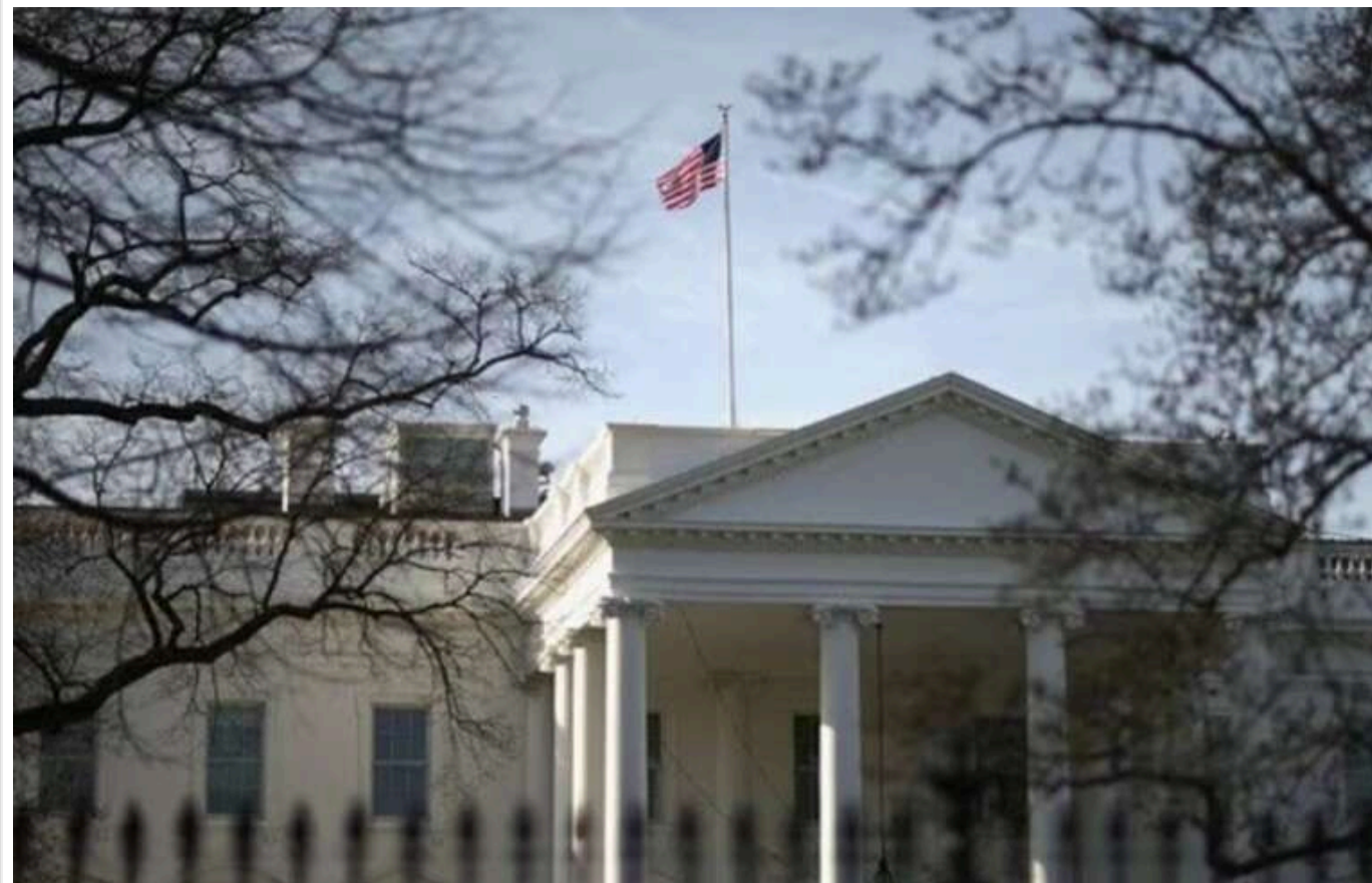
Білий дім ще в 2022 році зрозумів, що «застряг» у війні в Україні

Ця інформація представлена в книзі американського журналіста Боба Вудворда «Війна», де наводяться особисті бесіди американських політиків.