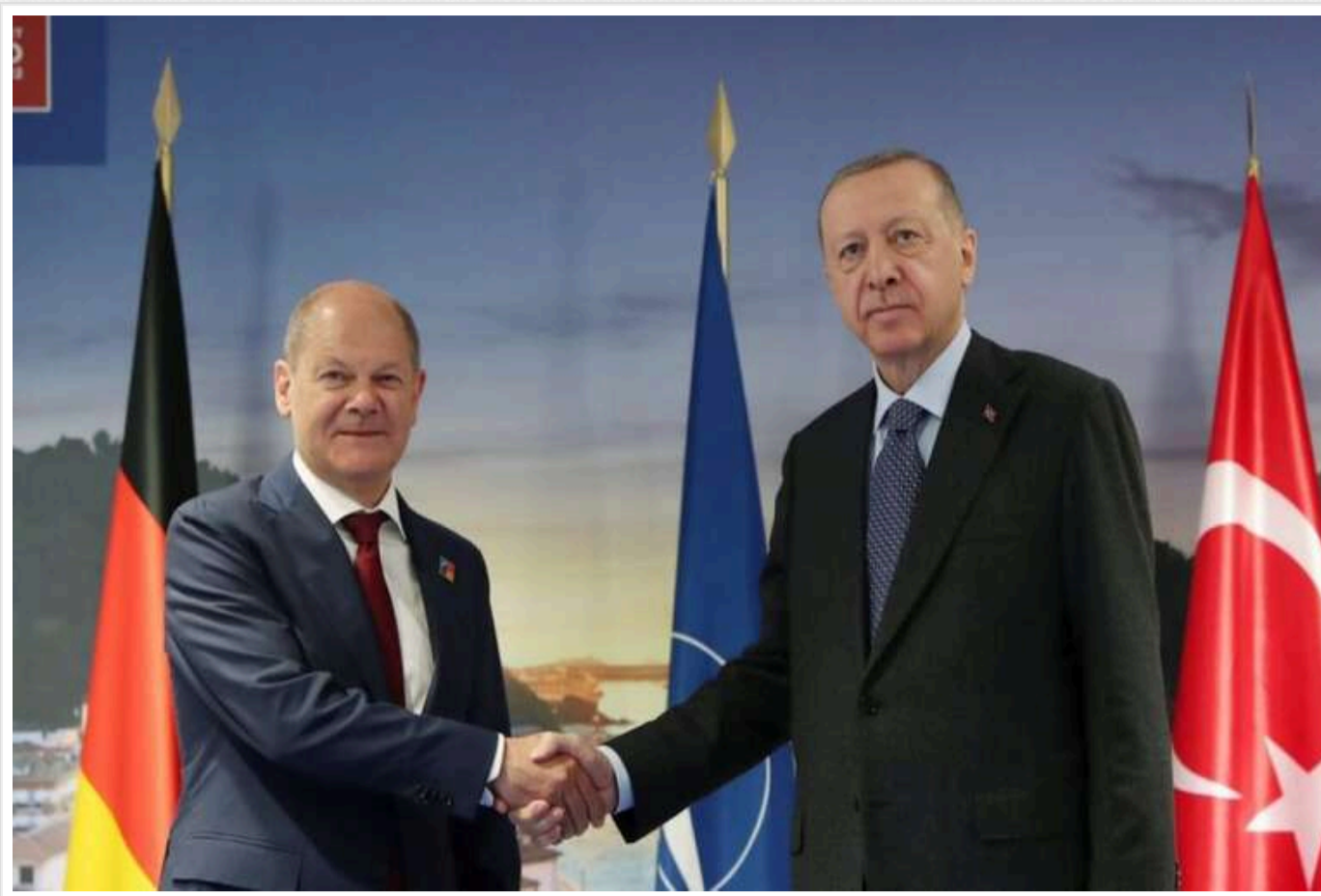
Канцлер Німеччини обговорить із президентом Туреччини Ердоганом шляхи припинення війни в Україні

Згідно з повідомленням офіційного представника уряду Німеччини Вольфганга Бюхнера, канцлер Олаф Шольц проведе зустріч із президентом Туреччини Реджепом Тайїпом Ердоганом у Стамбулі в суботу, 19 жовтня.