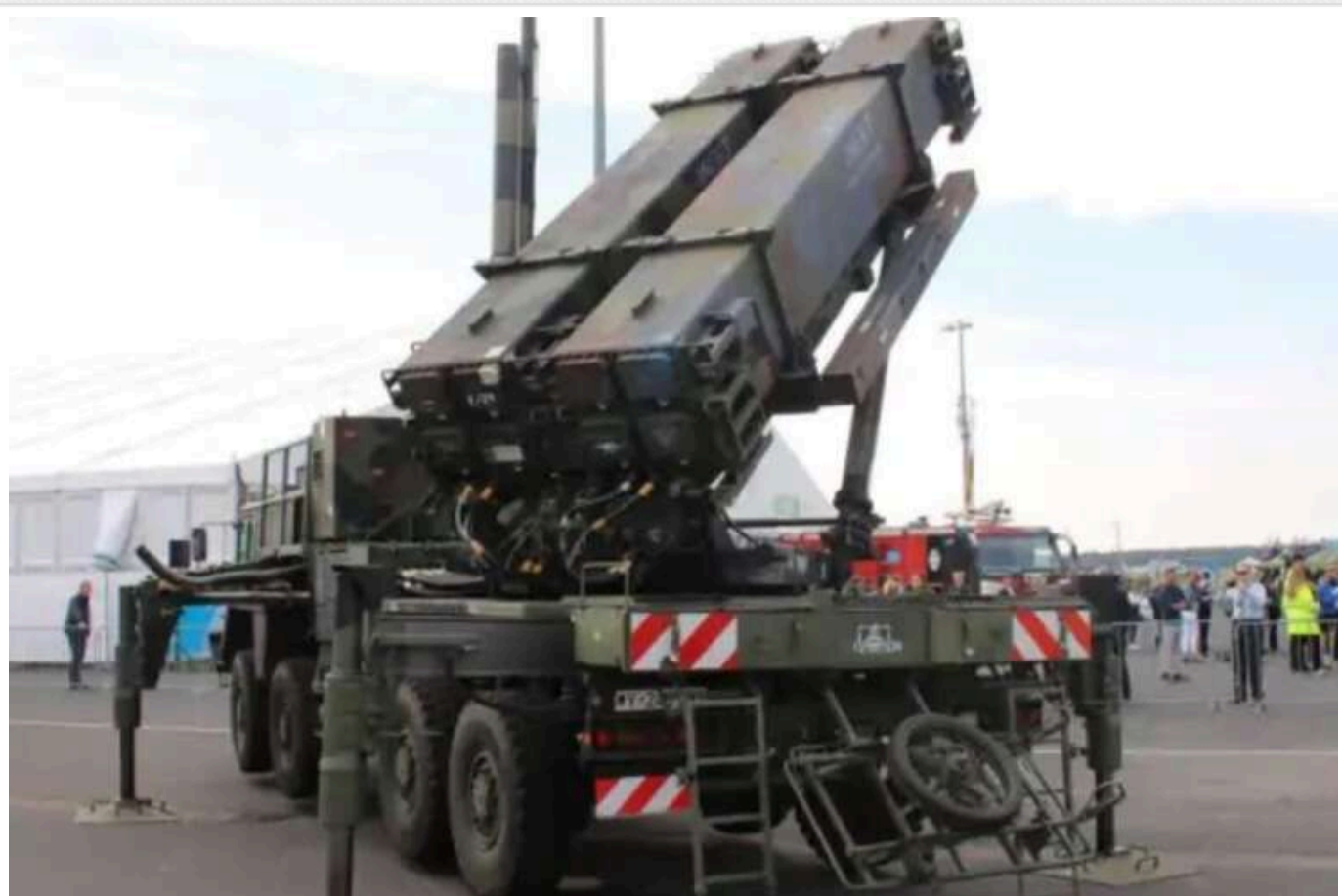
Німеччина надасть Україні ракети для систем FrankenSAM

Берлін анонсував новий пакет військової допомоги Україні, куди увійшли системи озброєнь, які раніше не постачалися для потреб ЗСУ, – ракети Sea Sparrow і Sidewinder.