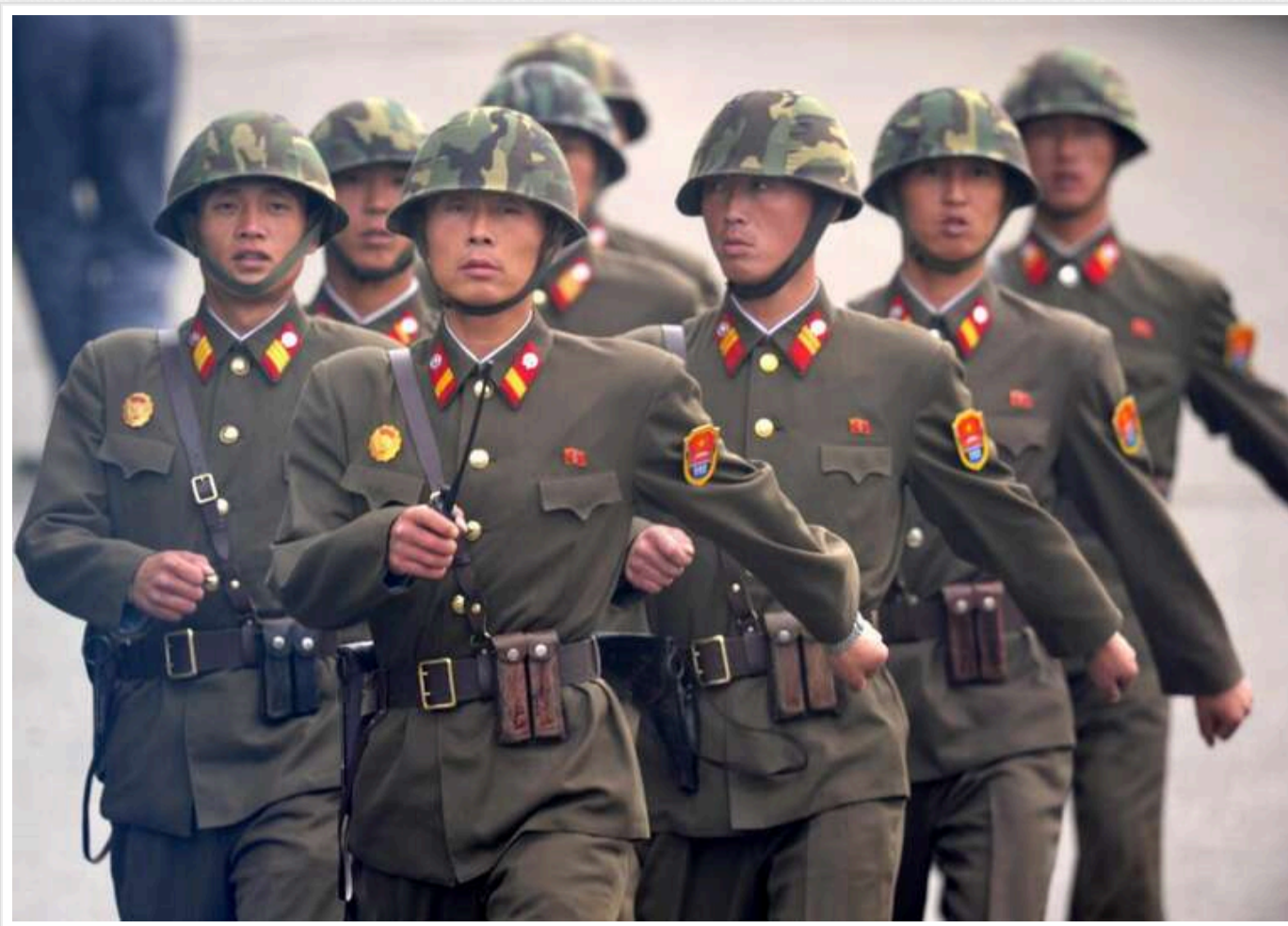
Майже 11 000 солдатів КНДР завершують підготовку в РФ, - Буданов

Про це заявив голова ГУР Буданов виданню The War Zone.