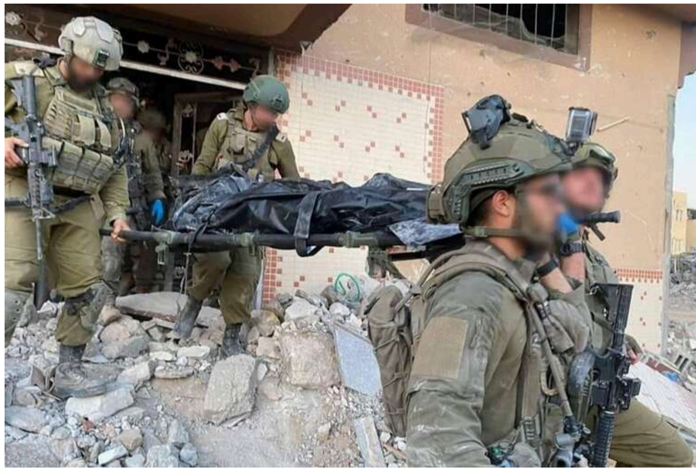
У ЦАХАЛ опублікували відео останніх хвилин життя лідера ХАМАС до того, як його вбили

ЦАХАЛ повідомляє, що минулої ночі військові вбили Сінвара, лідера терористичної організації ХАМАС. Згідно з даними ізраїльських військових, Сінвар спланував і здійснив напад на країну, який стався 7 жовтня 2023 року.