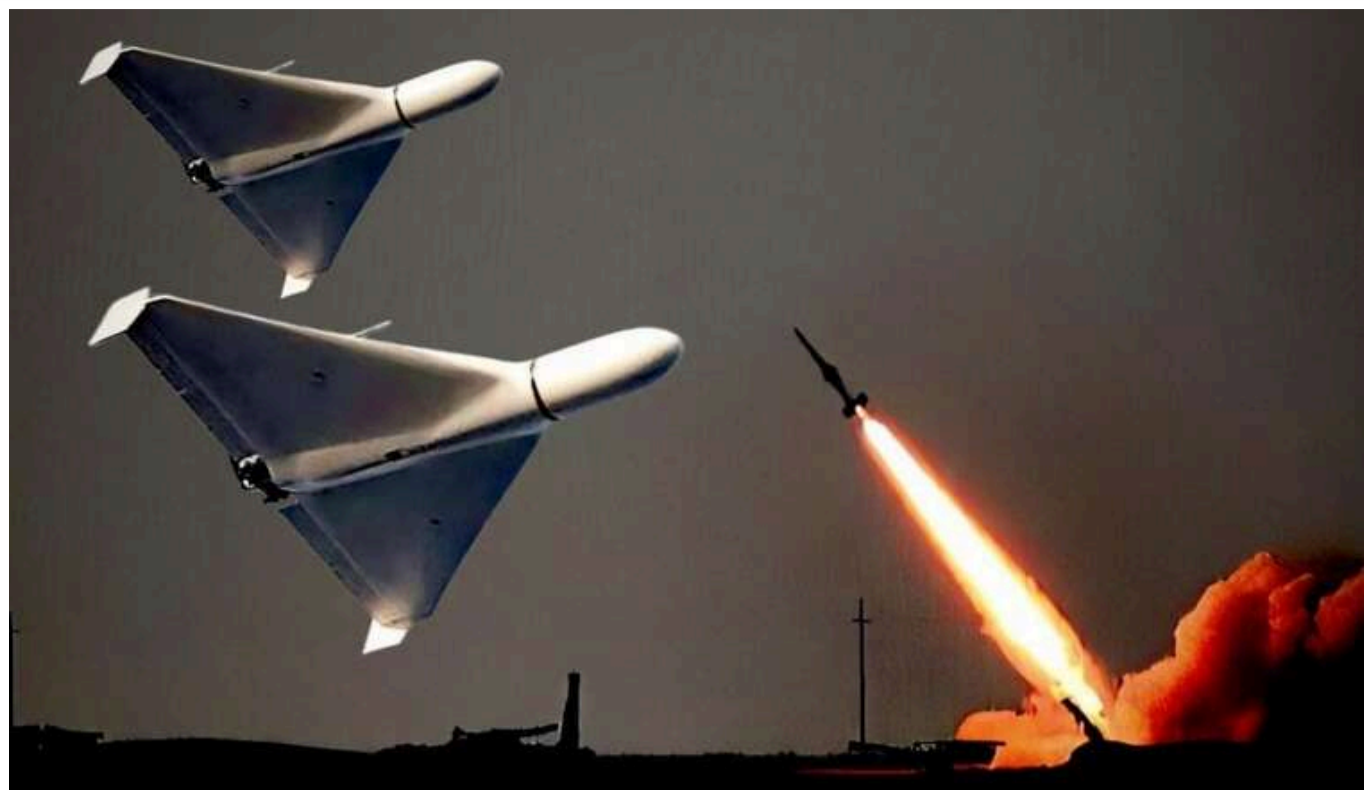
Сили ППО знищили вночі 80 із 135 БпЛА, — ПС