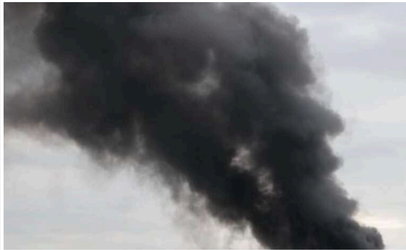
Окупанти обстріляли Марганець із артилерії

У п'ятницю зранку, 18 жовтня, російські сили здійснили артилерійський обстріл міста Марганець на Дніпропетровщині.