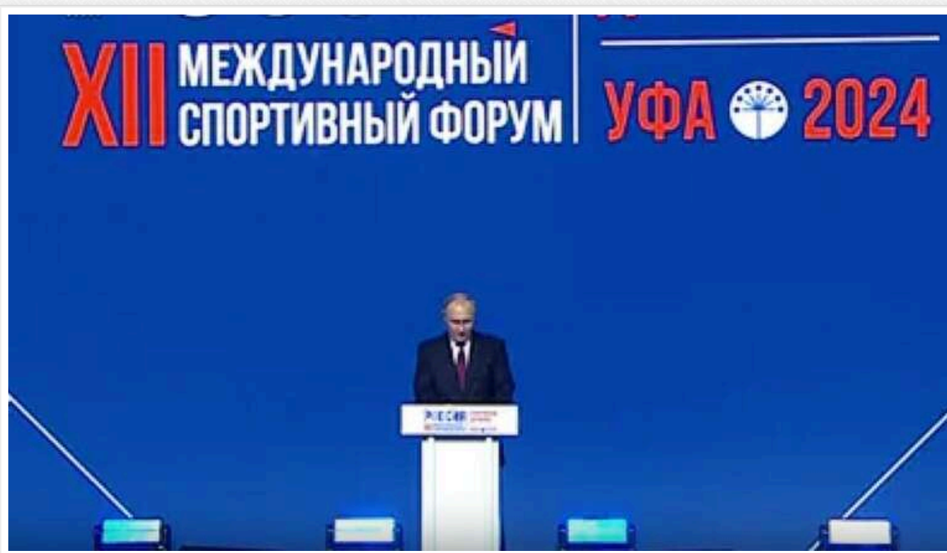
У РФ висміяли Путіна після його заяви на спортивному форумі

Російський диктатор Володимир Путін заявив, що світовий спорт намагаються перетворити на майданчик для геополітичних ігор. На думку лідера Кремля, необхідно очистити спорт від "вульгарної політизації, подвійних стандартів, викривлених правил, принизливої дискримінації".