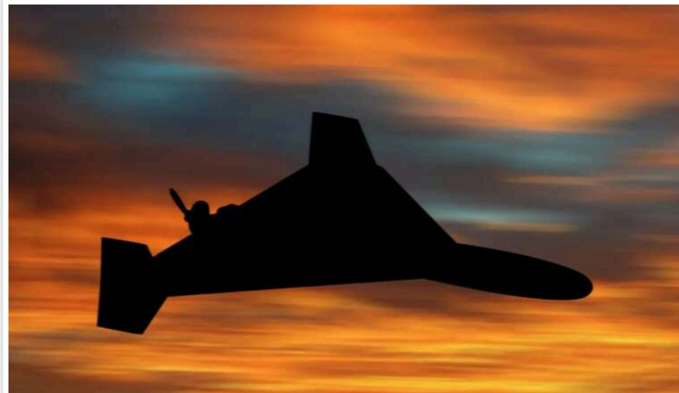
Окупанти запустили "Шахеди" з Сумського напрямку: оголошено тривогу

Увечері 17 жовтня російські війська знову атакують українські міста ударними БПЛА типу Shahed 136. Ворожі дрони проникли на територію України з північно-східного напрямку.