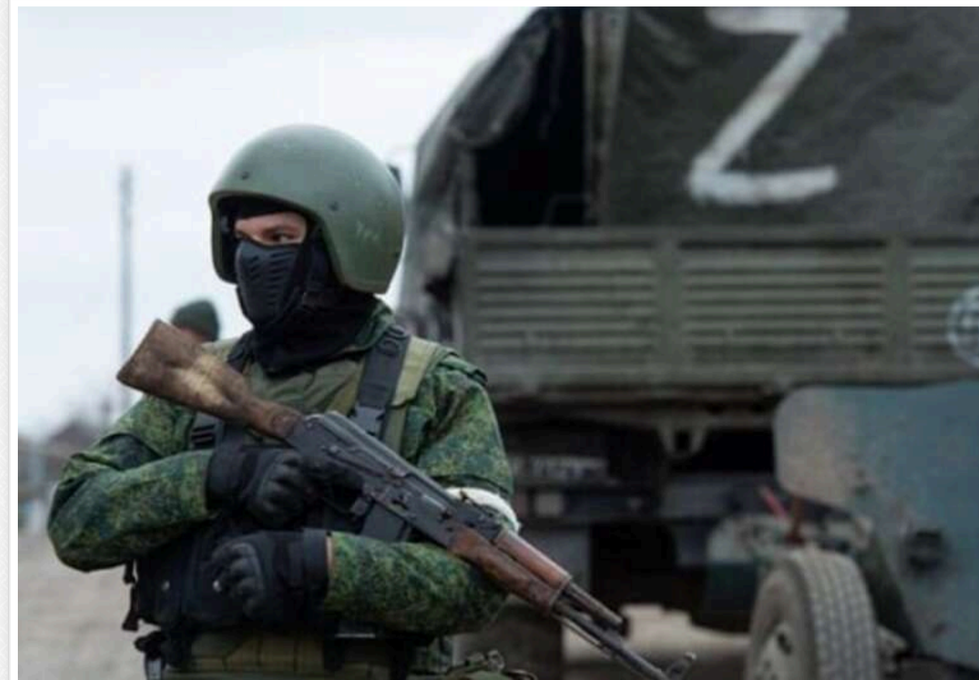
Росіяни окупували Максимільянівку на Курахівському напрямку, - військовий ЗСУ

Військовослужбовець з позивним «Мучний» підтверджує заяву Міноборони РФ про взяття Максимільянівки на Курахівському напрямку.