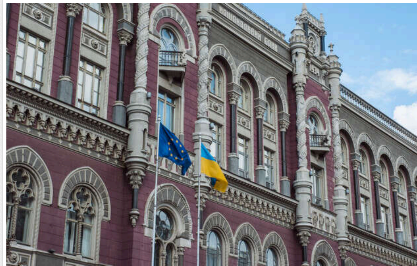
Нацбанк закликав банки активно стежити за фізичними особами-підприємцями та застосовувати до них санкції

НБУ анонсував битву банків з фізичними особами-підприємцями, які, на думку НБУ, дозволяють великому бізнесу мінімізувати податкові платежі та переводити в готівку кошти.