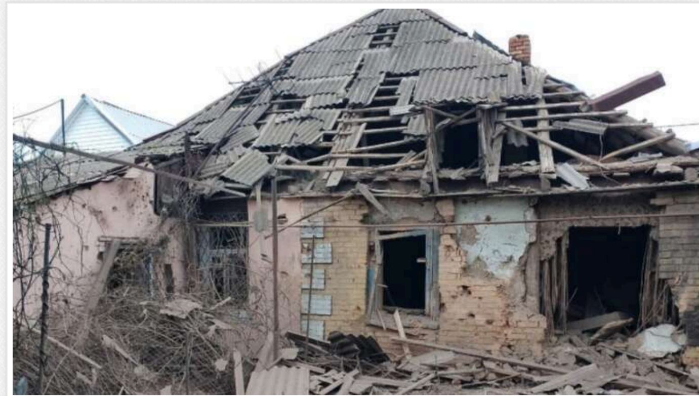
Російські загарбники більше 30 разів обстріляли Нікопольщину: є поранені

17 жовтня російські війська понад 30 разів обстріляли Нікопольський район на Дніпропетровщині, травмовано трьох людей.