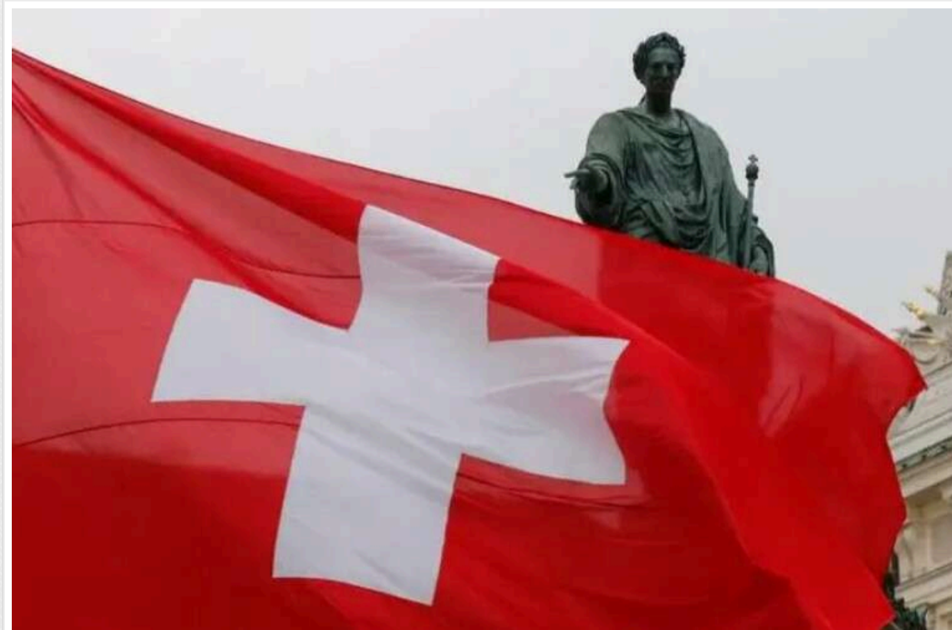
Швейцарія не погодилася запровадити всі санкції ЄС проти Росії

Швейцарія прийняла рішення не запроваджувати повний пакет санкцій ЄС проти Росії, обґрунтовуючи це наявністю національних механізмів для контролю дочірніх компаній. Це рішення викликало критику, оскільки воно може послабити міжнародний тиск на Росію.