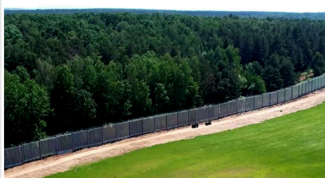
У Польщі від початку року на кордоні з Білоруссю постраждали 63 військових

У Польщі з початку цього року від агресивних дій нелегальних мігрантів, які намагалися проникнути до країни, постраждали 63 військовослужбовці.