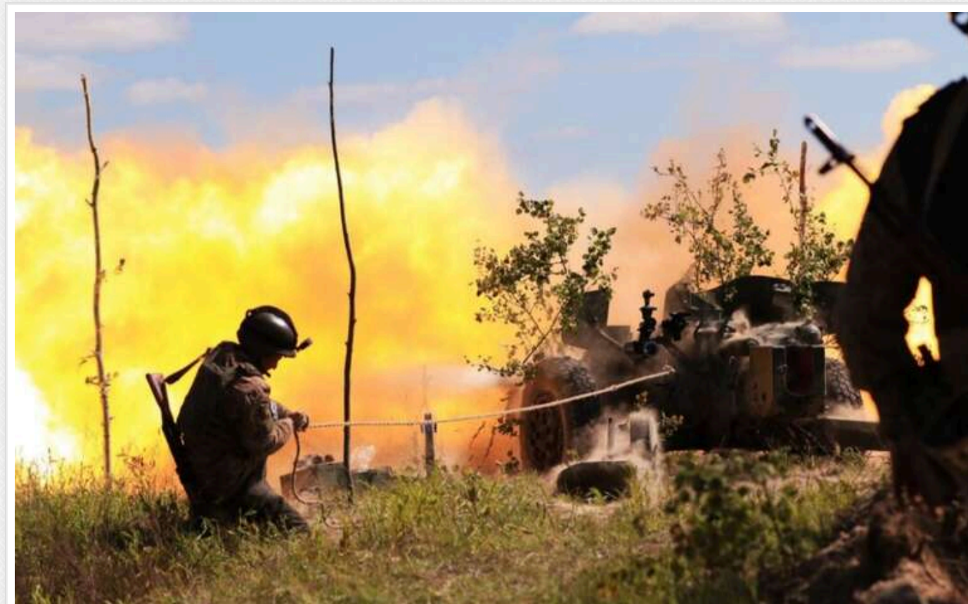
Операція ГУР і НГУ: Зачистка лісу в Харківській області тривала понад 2 місяці

Протягом операції в лісі на півночі Харківщини, яка тривала понад два місяці, взяли в полон кілька десятків російських військових.