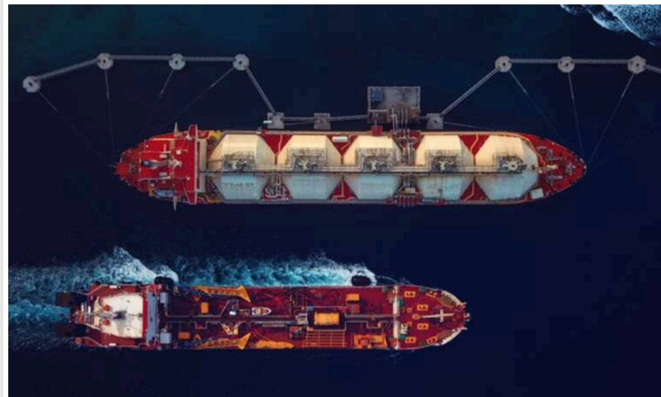
Politico: "Тіньовий" російський флот розливає нафту у водах по всьому світу

За 100 км від узбережжя Шотландії було виявлено темну пляму, яка, згідно з аналізом, належала російському тіньовому танкеру Innova, що перевозив 1 мільйон барелів нафти.