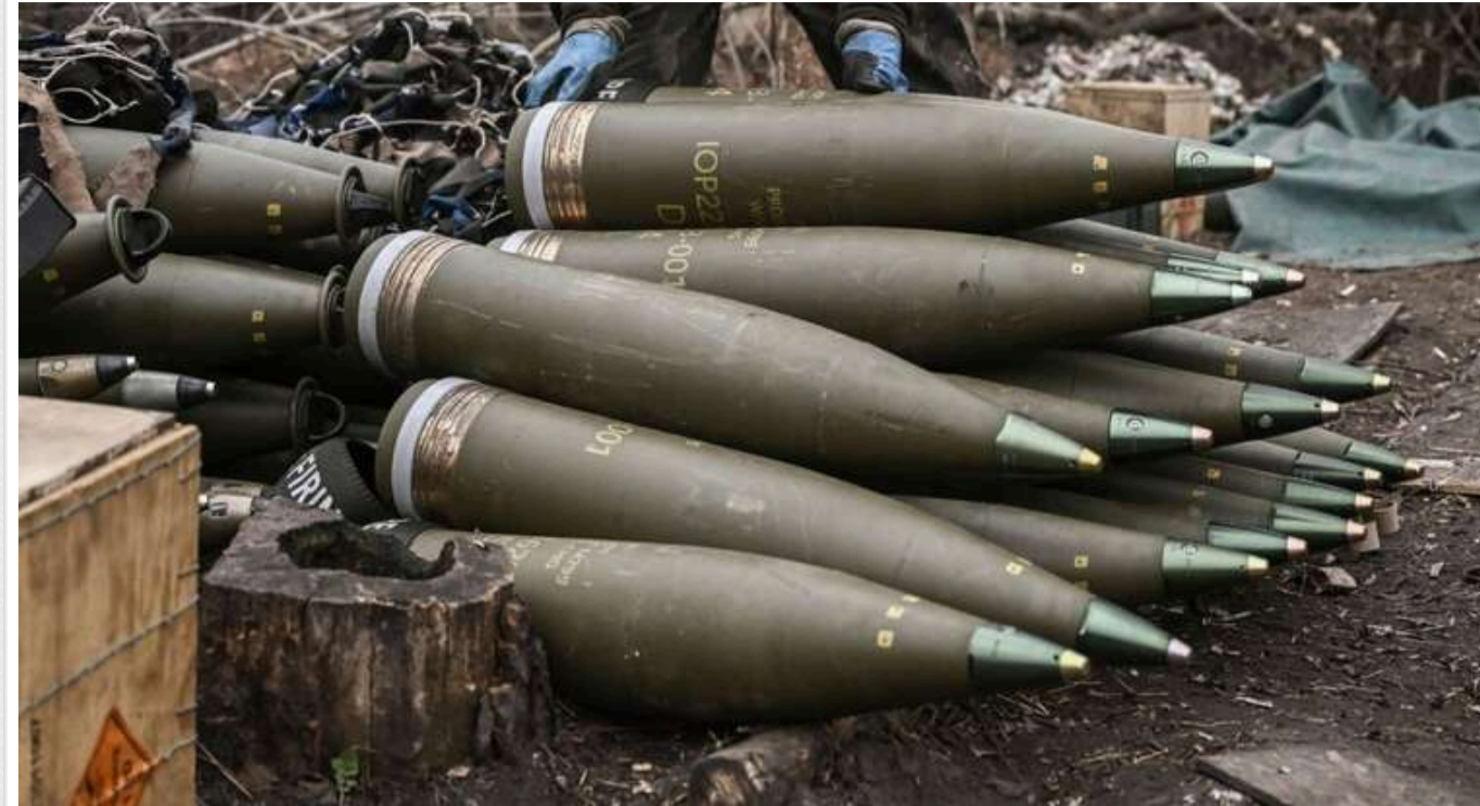
Нідерланди нададуть 271 мільйон євро на великокаліберні артилерійські снаряди для України

Нідерланди планують збільшити постачання великокаліберних артилерійських боєприпасів для України, виділяючи на це ще 271 млн євро.