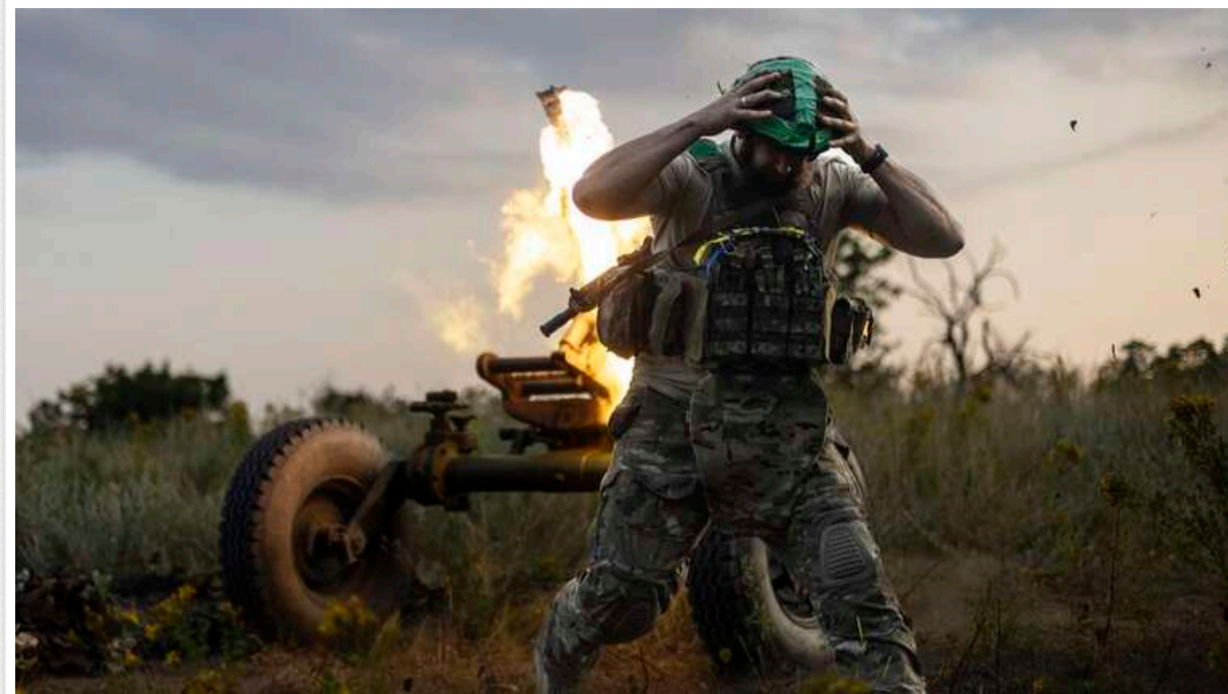
Ситуація на фронті: від початку доби відбулось 112 бойових зіткнень

На фронті від початку доби сталося 112 бойових зіткнень, з них 46 – на Курахівському напрямку.