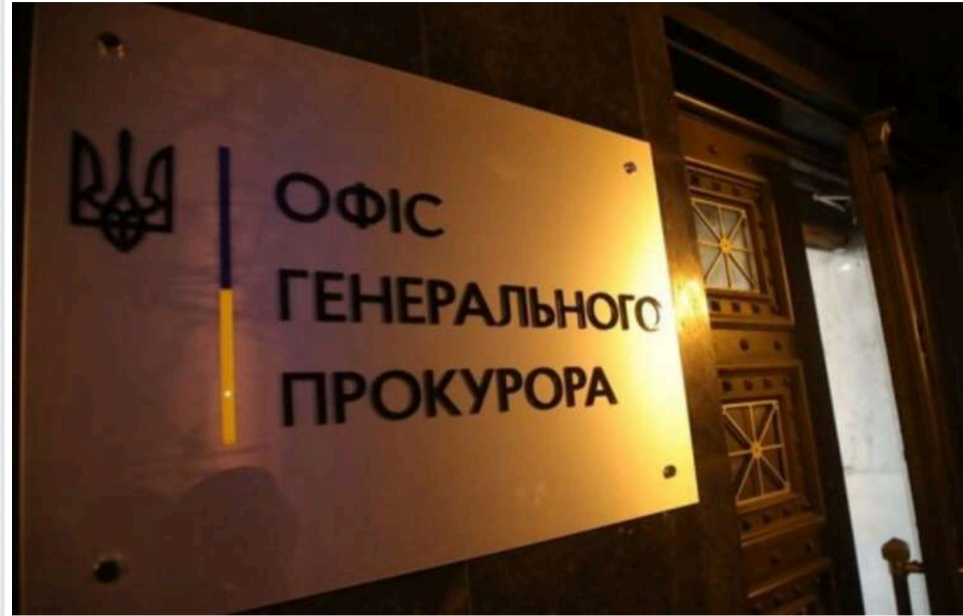
Генпрокуратура проведе перевірку після інформації у ЗМІ про фейкову інвалідність п'ятдесяти прокурорів

Генеральна прокуратура повідомляє про початок розслідування у зв'язку з інформацією в ЗМІ про те, що близько п'ятдесяти прокурорів у Хмельницькому оформили інвалідність.