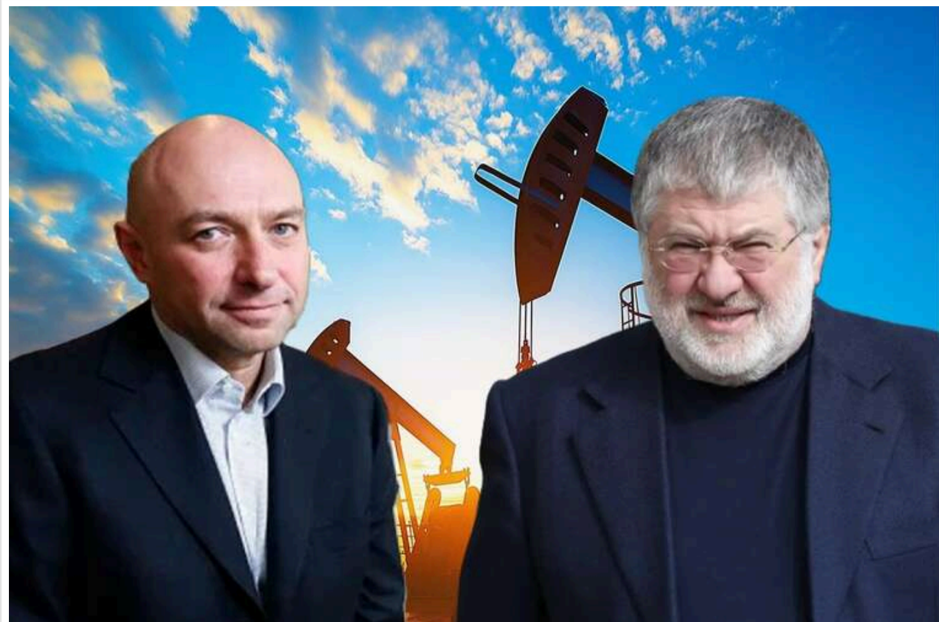
JKH Oil & Gas контролюють Боголюбов і Коломойський: журналісти знайшли чергове підтвердження

JKH Oil & Gas, яка намагається спростувати свою причетність до Коломойського і Боголюбова, веде хвалебну кампанію на підконтрольних саме їм медіаресурсах.