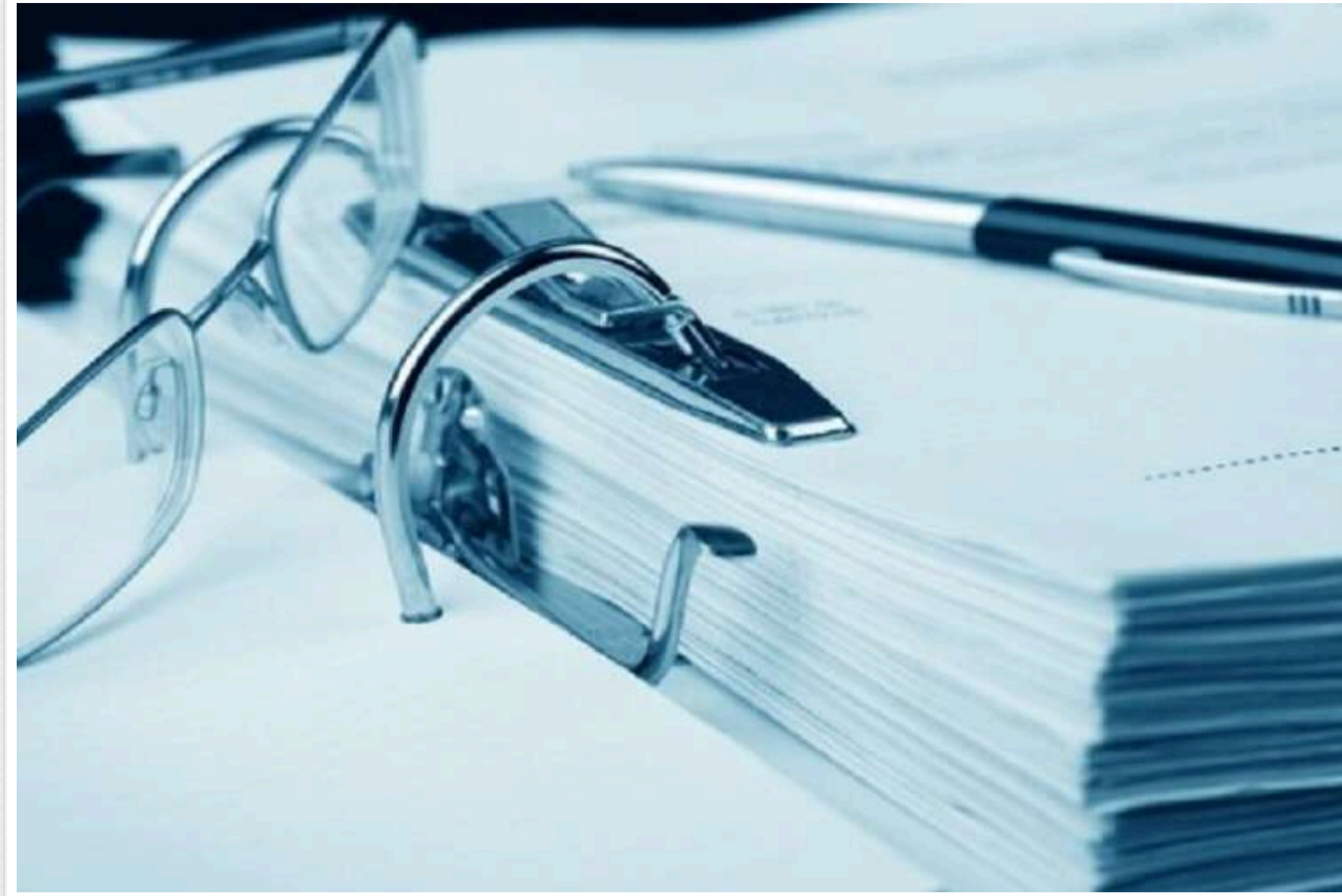
Третина українських компаній не "потягне" нові, підвищені податки: може піти в тінь

Європейська Бізнес Асоціація фіксує зростання кількості компаній, які можуть опинитися в скрутному становищі через збільшення податків.