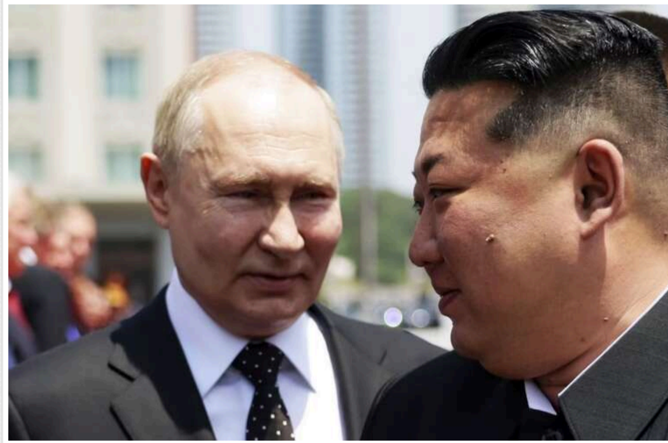
В ISW пояснили, що стоїть за партнерством Росії і КНДР

Кремль використовує укладену в червні цього року угоду про всеосяжне стратегічне партнерство з Північною Кореєю, щоб відтермінувати оголошення мобілізації в Росії. Зокрема, військовослужбовці з КНДР почали відправляти в прикордонні райони Курської та Брянської областей.