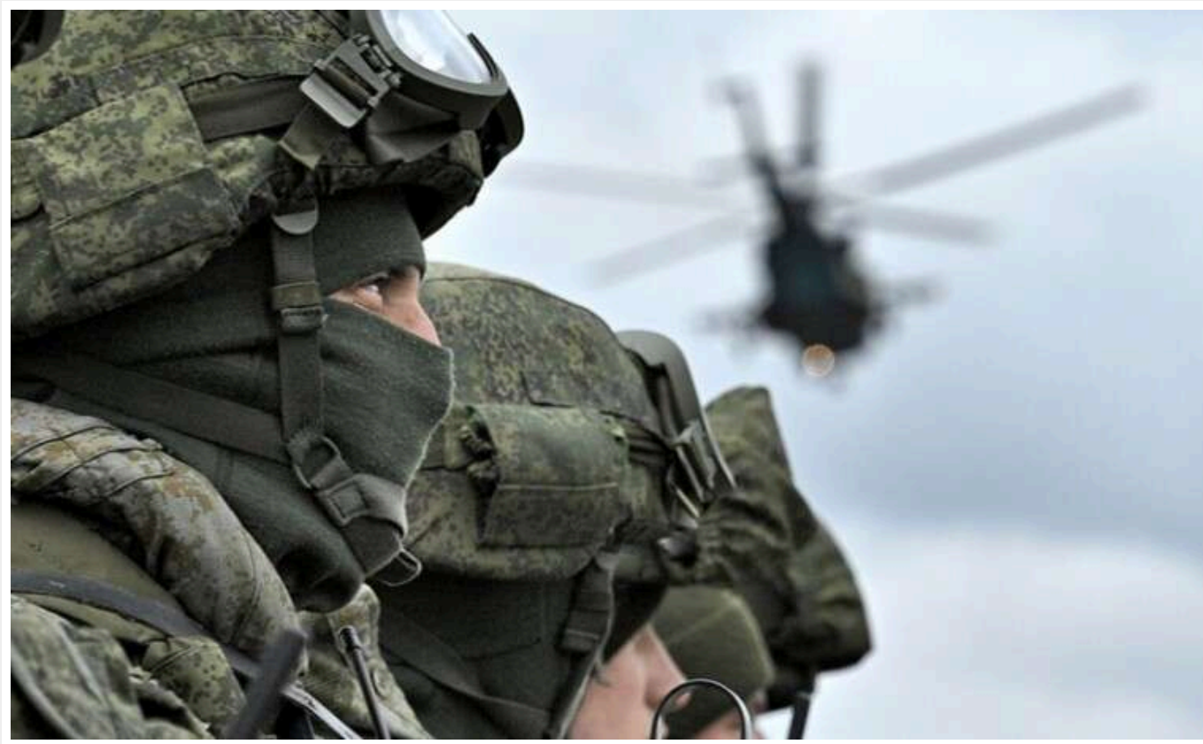
ЗС РФ просунулися по східному краю українського виступу на Курщині, бої тривають, - ISW

Нещодавно російські сили просунулися до східного краю виступу на Курщині, який контролюють Збройні сили України. Росіяни намагаються оточити українські війська в районі на південний схід від Суджі.