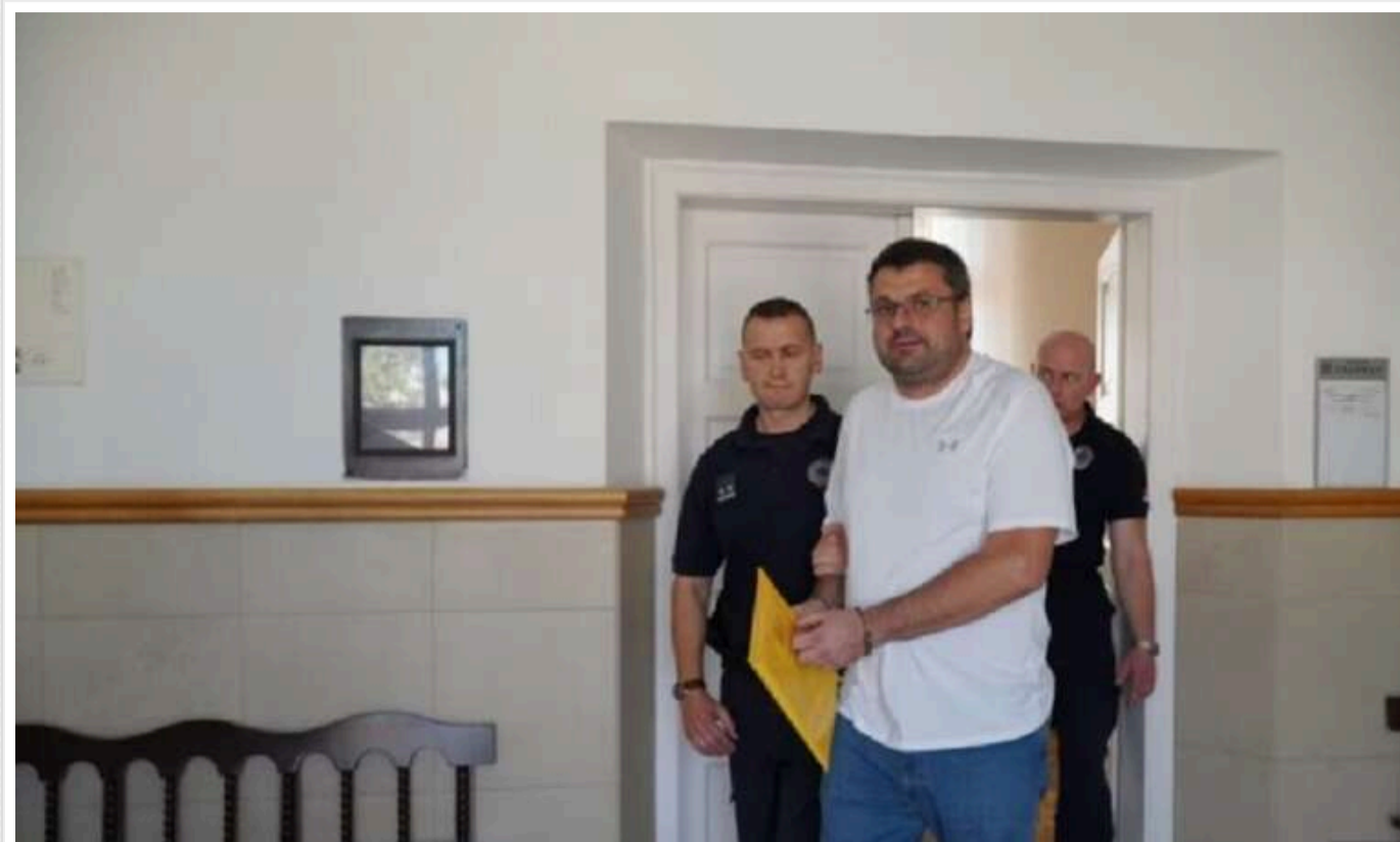
Ексгенерала СБУ Наумова знову засудили в Сербії за відмивання грошей

Екссолову Головного управління внутрішньої безпеки Служби безпеки України Андрія Наумова в Сербії знову визнали винним у відмиванні грошей. Цього разу колишньому посадовцю СБУ призначили покарання у вигляді одного року позбавлення волі.