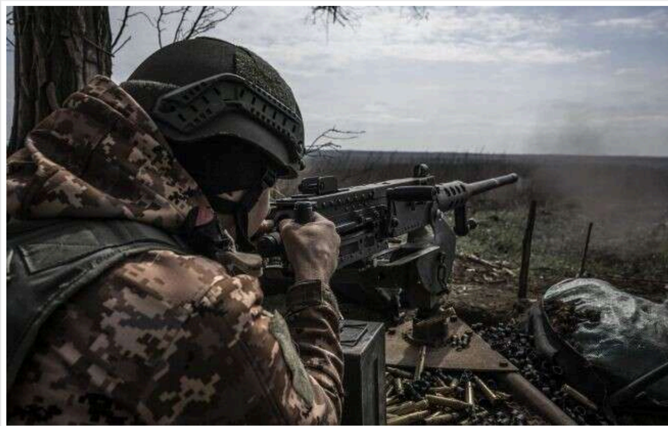
Південніше Покровська позиції виглядають як траншеї, викопані екскаватором, – OSINT-аналітик

Ці укріплення зводив інженерний підрозділ, прикомандирований на цей напрямок, а не бригада, яка там розміщена.