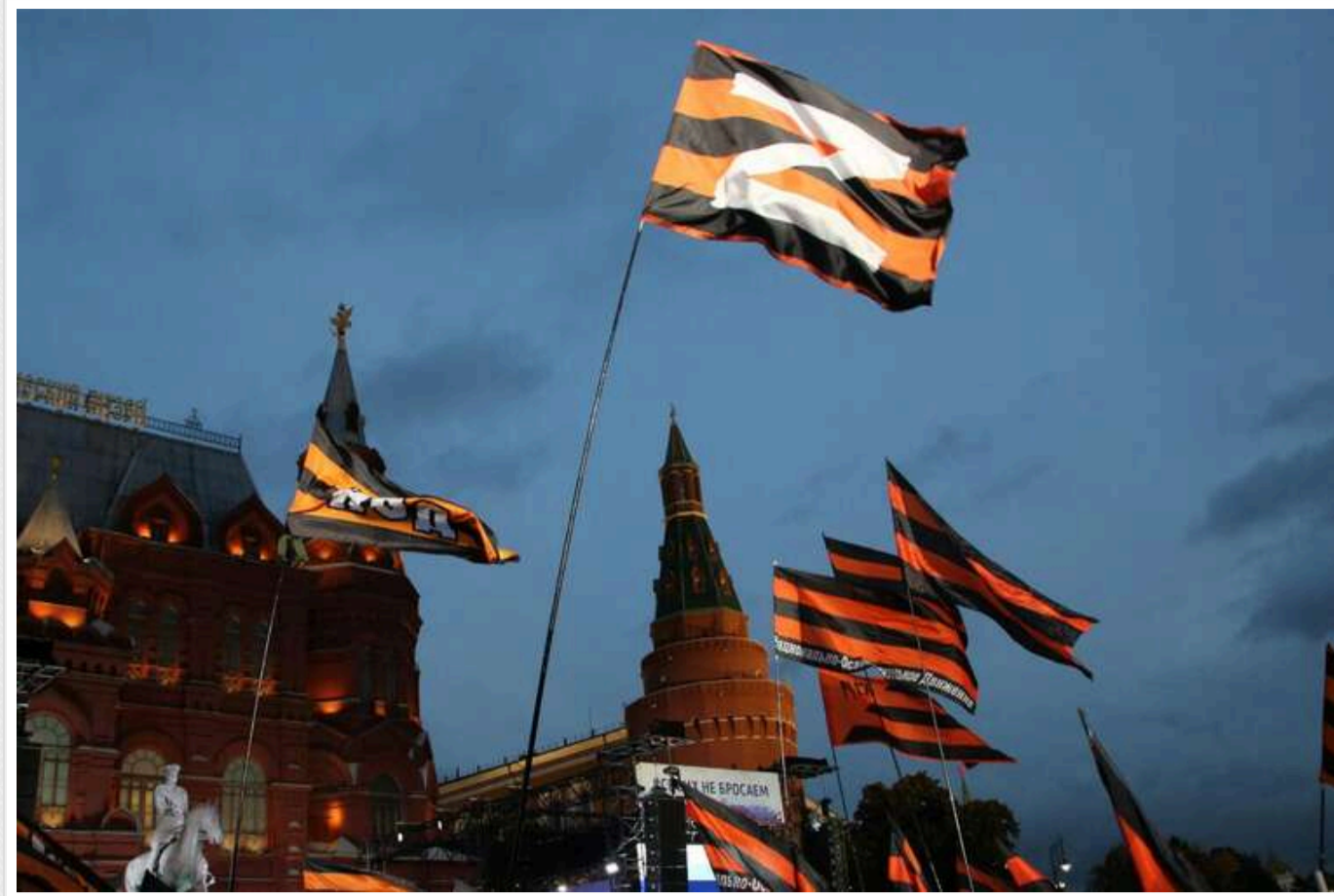
Кремль просуває «русский мир» серед західних підлітків

Існуюча з 2014 року програма «Здрастуй, Росіє!» спрямована на просування «традиційних цінностей» і «русского мира».