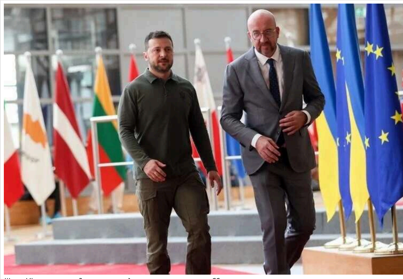
Шарль Мішель запросив Зеленського представити план перемоги в ЄС

Президент Європейської ради Шарль Мішель запросив українського лідера Володимира Зеленського на саміт ЄС, який відбудеться 17 жовтня.