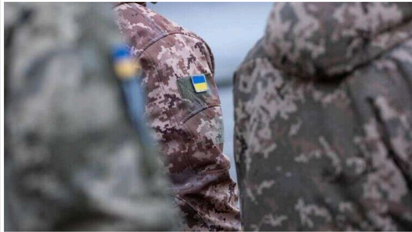
У Житомирі чоловік вирішив станцювати перед працівниками ТЦК, які перевіряли документи

Коли чоловік танцював, він дістав якийсь документ. У Житомирі чоловік почав танцювати перед працівниками Територіального центру комплектування і соціальної підтримки (ТЦК СП), які перевіряли документи в інших.