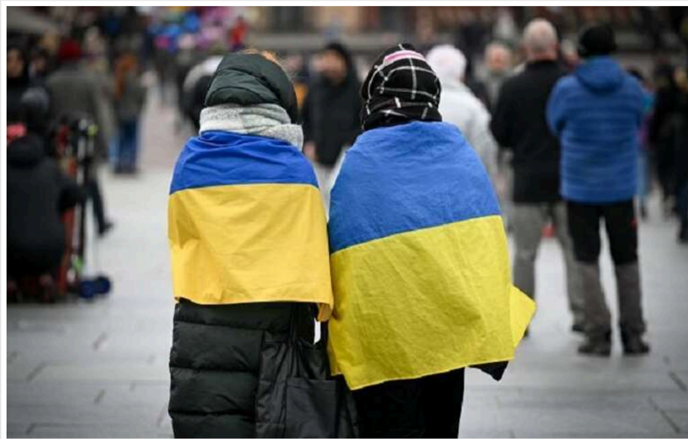
Українці масово втікають з Польщі: шукають кращі умови роботи

Вказується, що українці шукають кращі умови роботи в інших країнах Європи.