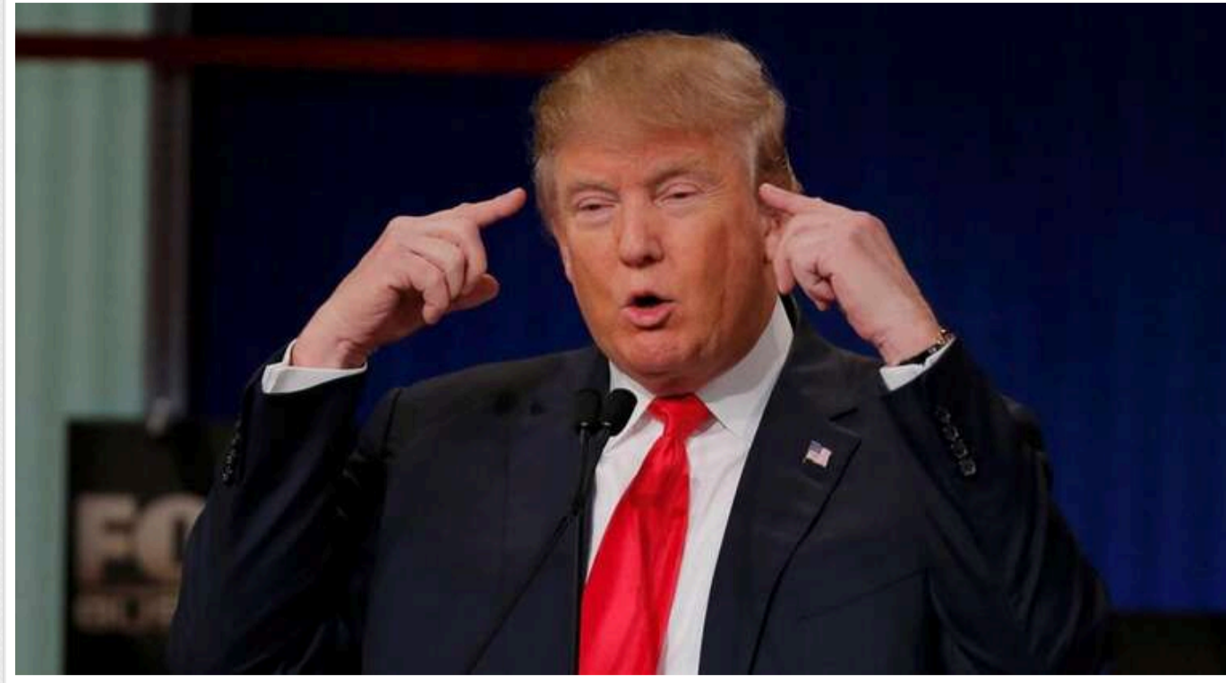
Мітинг Трампа в Пенсильванії зірвався через задуху: глядачі непритомніли, а експрезидент танцював на сцені

Передвиборчий мітинг колишнього президента США Дональда Трампа, який він планував провести в понеділок, 14 жовтня, у передмісті Філадельфії, штат Пенсильванія, був достроково завершений після того, як у деяких глядачів почалися непритомності, і їм знадобилася медична допомога.