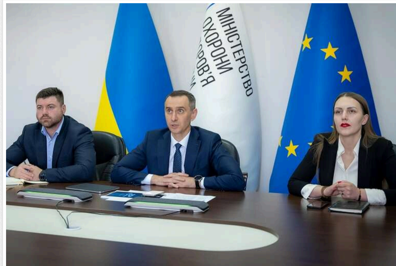
Реформа МСЕК: МОЗ розробило законопроект та розпочало консультації з громадськістю

Визначення потреб людини та максимальне повернення у соціум з можливістю активного життя та працевлаштування – це загальна мета реформування системи медико-соціальної експертизи. Це є системною і комплексною реформою, яка включає зміни в медичній та соціальній сфері.