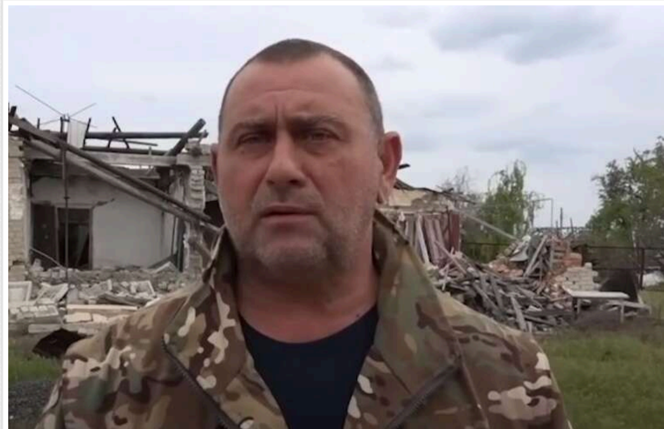
Пропагандиста Максима Калашникова засмутив "безлад" у Курській області

Для своїх військових у Курській області Москва не може забезпечити навіть найелементарніші речі, скаржиться пропагандист Максим Калашников.