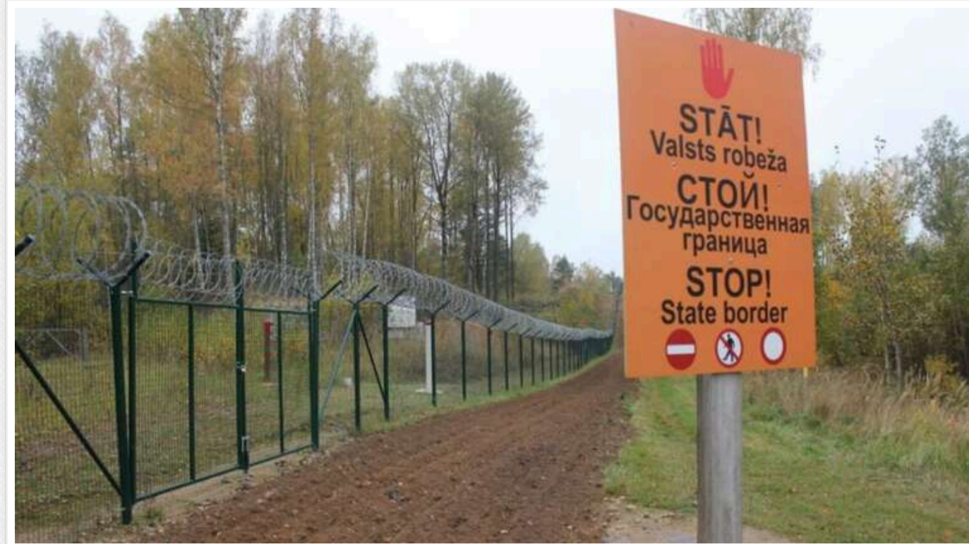
Туск оголосив про початок будівництва в рамках проекту «Щит Схід» на кордоні з Росією та Білоруссю

Польща почала будівництво системи укріплень, фортифікаційних загороджень, передових баз і логістичних центрів на кордоні з Росією та Білоруссю. Реалізація проекту "Щит Схід" була запланована на 2025-2028 роки, але початок відбувся раніше.