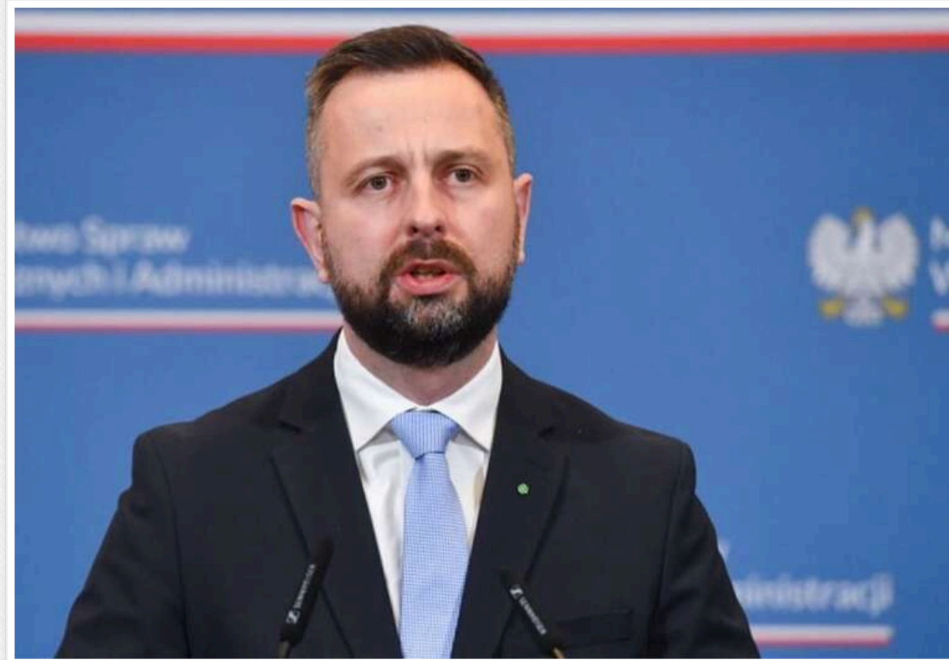
Вступ України в ЄС не є питанням «бути чи не бути», - Косіняк-Камиш

Вступ України до ЄС не стоїть на порядку денному як дилема «бути чи не бути», тому в процесі її інтеграції в Європу Польща може висувати свої вимоги, що стосуються історичного минулого.