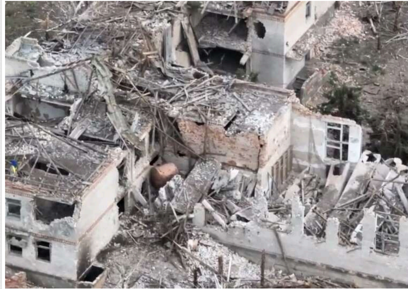
На ростБ показали, як "допомогли" мешканцям окупованого Роботиного і Вербового на Запоріжжі

Кремлівські пропагандисти відверто заявляють, що російська армія руйнує будинки мирних мешканців України. Водночас вони нарікають на чиновників, які нібито не бажають виплачувати компенсації людям.